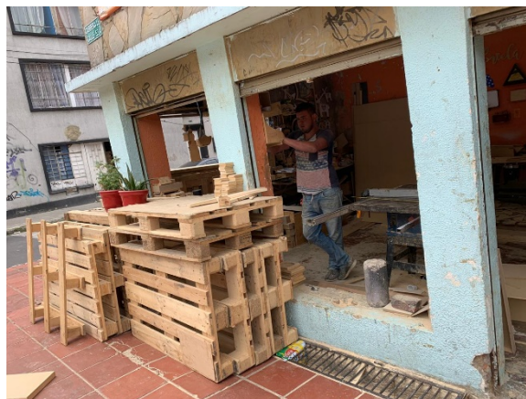
FOTOGRAFÍA N°. 4 ÁREA DE LA BODEGA SIN CONFINAR